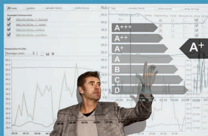
Webbasiertes Datenmonitoring der Heizungsanlagen mit Energienachweis.