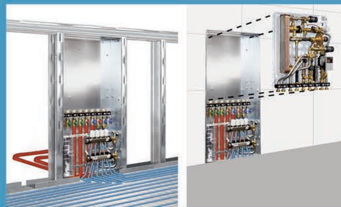
Anbindung der Versorgungsleitung in der Rohbauphase. Spätere Endmontage der Station bei Fertigmontage.

Jahrelange Erfahrungen in der Projektierung zeichnen das Unternehmen KaMo als Hersteller und Dienstleister aus.